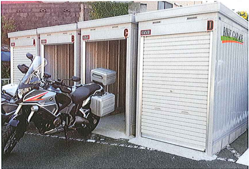
専用バイクガレージ 5,000/月