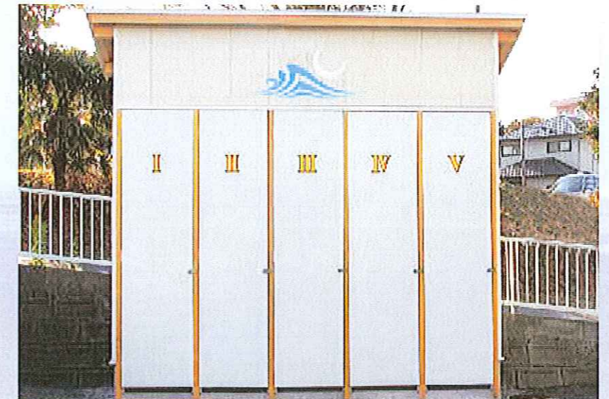
ボードロッカー 2,000/月